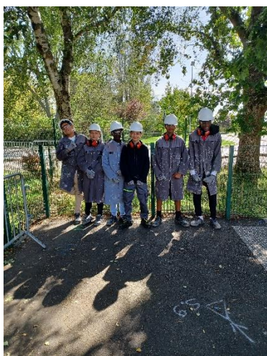
Elèves de 3 ème SEGPA HAB

La réalisation d'un restaurant d'application sur un espace végétalisé. L'ouvrage achevé servira aux classes de HAS pour la vente de plats aux élèves et aux enseignants. La réalisation est composée d'une ossature bois sur plots béton, d'une terrasse en bois, d'un banc, d'un garde-corps, d'un bardage bois, d'un abri de jardin réadapté et renforcé, d'un haut vent, et d'une toiture en tôles.