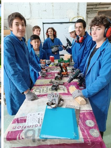
Elèves du Club Bricolage